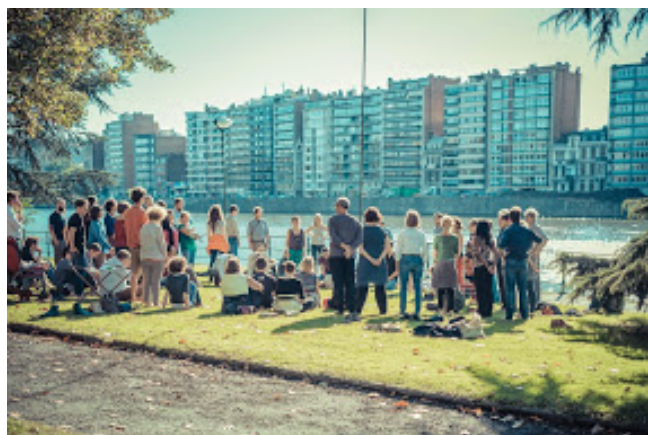
Etape 2 - Liège

L'objectif de ce parcours, initié par la Fondation pour les Générations Futures en partenariat avec Business & Society Belgium, Inter-Environnement Wallonie et ConcertES, est de renforcer la dynamique de transition vers une société plus soutenable en provoquant des rencontres entre « Créateurs d'Avenir » au-delà des réseaux et des barrières sectorielles existantes : un coup d'accélérateur au développement soutenable dans nos régions et à l'émergence de solutions innovantes, hors cadre, réalisables et durables aux défis auxquels notre société fait face aujourd'hui.