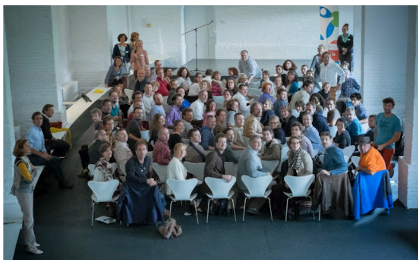
Les 100 Créateurs d'Avenir Etape 1 du Parcours au Grand Hornu - le 11 septembre 2014

Un Parcours en 3 étapes de 100 Créateurs d'Avenir pour construire une société plus soutenable